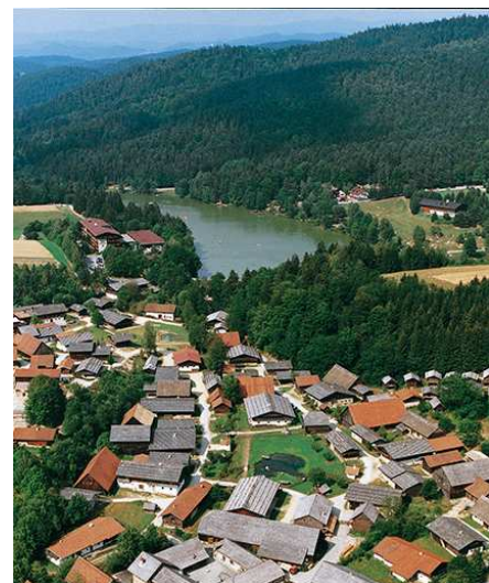
unser Hotel am Dreiburgensee im Vordergrund das Museumsdorf