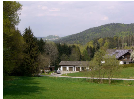
im Hintergrund die Saldenburg