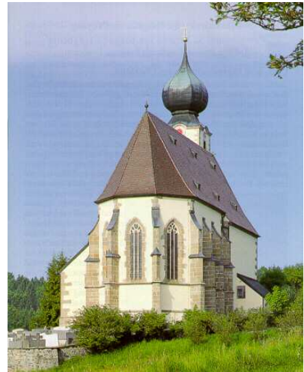
St. Brigida in Preying